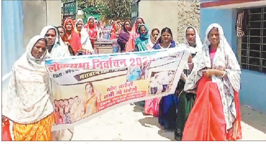
स्वीप के तहत जागरूकता रैली निकालती मितानिन।

विगत दिवस विकासखंड खडुगवां के मितानिनों के द्वारा बिजली ऑफिस से लेकर एकलव्य स्कूल पोड़ीडीह तक खडुगवां के समस्त चौक-चौराहों में मतदाता जागरूकता रैली निकाली गई और समस्त नागरिकों से लोकतंत्र के महापर्व पर शत-प्रतिशत मतदान करने अपील किया गया और मतदाताओं से लोकसभा निर्वाचन में अपना मतधिकार का योगदान देने आह्वान किया। खडुगवां में स्वास्थ्य विभाग द्वारा आम नागरिकों को जागरूक करने के उद्देश्य से जागरूकता रैली निकाली गई। इसमें समस्त मितानिन और मितानिन प्रशिक्षक साथ में विकासखंड से मितानिन विकासखंड समन्वयक ने बड़-चढ़ कर भाग लिया। स्वास्थ्य विभाग द्वारा स्वीप के माध्यम से रैली निकाली गई। वहीं रैली में शामिल अधिकारियों ने मतदाताओं से अपील करते हुए आगामी लोकसभा चुनाव में शांतिपूर्ण माहौल में अपने मतधिकार का प्रयोग करने को लेकर जागरूक किया। मतदाता जागरूकता रैली के दौरान खडुगवां स्वास्थ्य विभाग के समस्त अधिकारी और कर्मचारी उपस्थित हुए। मतदाता जागरूकता रैली के दौरान वोट डालने जाना है अपना फर्ज निभाना है, बूढ़े हो या जवान सभी करें मतदान, आपका मतदान ही लोकतंत्र को जान है जैसे स्लोगन का वाचन करते हुए 7 मई को मतदान करने अपील करते हुए लोगों जागरूक किया गया।